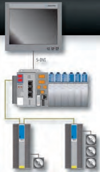
Als Master-Steuerung agiert eine leistungsfähige »C-Dias«-SPS, die u.a. für die exakte Synchronisierung der Achsen sorgt. Bedient wird über ein 15"-Touchdisplay. Intern kommunizieren die Automatisierungskomponenten über den schnellen Echtzeit-Ethernet-Bus Varan, softwareseitig kommt das objektorientierte All-in-One-Engineering-Tool »Lasak« zum Einsatz.

Nur ein knappes dreiviertel Jahr dauerte die Entwicklung, Konstruktion und Fertigung des neuartigen Spritzgießmoduls. Möglich wurde diese schnelle Realisierung u.a. aufgrund der engen Partnerschaft mit dem langjährigen Automatisierungstechnik-Lieferanten Sigmatek. „Die Zusammenarbeit mit Sigmatek funktioniert seit jeher sehr gut.